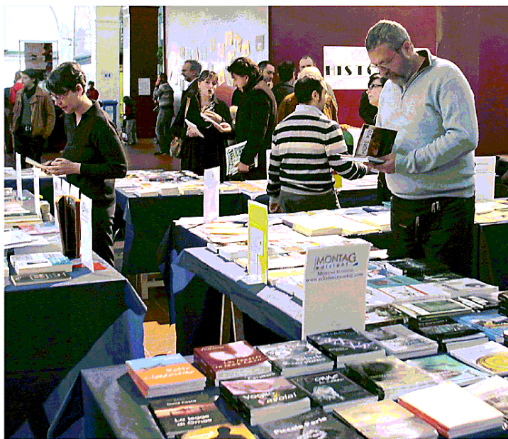
BUK TORNA IN SAN PAOLO IN ALTO A DESTRA I JALISSE SOTTO GLI OLOGRAMMA

In cartellone, dal 6 all'8 maggio la mostra mercato al Chiostro di San Paolo, in via Francesco Selmi n. 67, con 16 incontri e 30 case editrici. Presentazioni il sabato e la domenica dalle 9.30 alle 19.30, il venerdì a partire dalle 15.00. Serata «Anteprima» il 2 maggio al teatro Storchi, e a giugno, dal 3 al 5, terza edizione di Buk Film Festival. Ideata da Francesco Zarzana – direzione generale Giovanna Del Conte, organizzazione Progettarte – la manifestazione, quest'anno, fa un omaggio a Pier Paolo Pasolini a cent'anni dalla sua nascita: in programma due grandi dialoghi d'autore, Davide Riondino e David Riondino cui è affidato «Il ritratto eretico» di Pasolini, (venerdì 6 maggio ore 18.30, Sala del Leccio) e Davide Toffolo - Gian Mario Villalta che lo racconteranno come Maestro (sabato 7 maggio ore 18.30, Sala del Leccio) Premio BUK Festival 2022 a Donatella Di Pietrantonio, (Premio Campiello 2017 per «L'Arminuta»), Premio Speciale Buk Award alla band degli Ologramma, formazione modenese di giovani artisti che include anche musicisti e cantanti «che hanno differenti abilità» come ha ricordato il prof. Gianni Ricci in conferenza stampa, che – in attesa di aprire il concerto di Vasco Rossi il prossimo 28 maggio a Imola – si esibiranno nelle hit dei Jalisse, ospiti straordinari della serata «Anteprima» di BUK. In cartellone presentazioni,